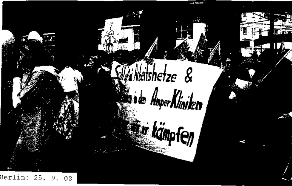
Berlin: 25. 9. 08

Herausgeber: Unabhängige Betriebsgruppe Amperkliniken Kontakt: betriebsgruppe.amperkliniken@yahoo.de im Web: www.ungesundleben.org/bgak